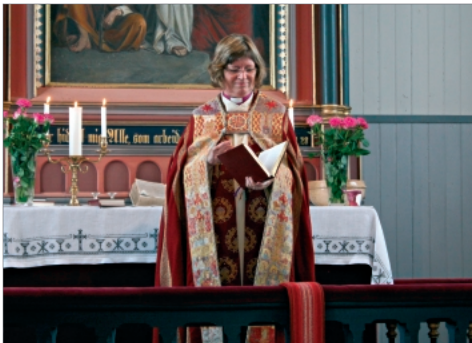
Biskop Ingeborg Midttømme.