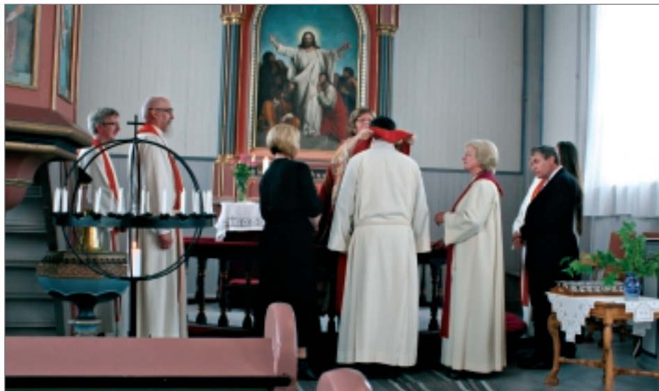
Stola-båndet blir lagt over prestens skuldre som en symbolsk markering.